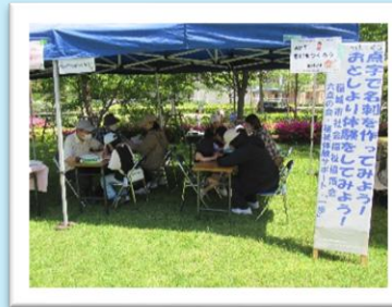
手作り市民まつり 点字体験