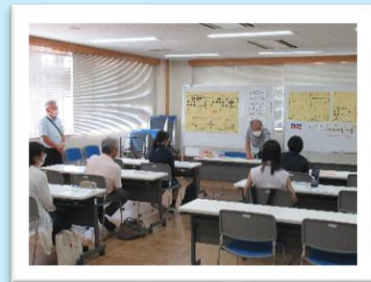
夏！体験ボランティア 点字体験